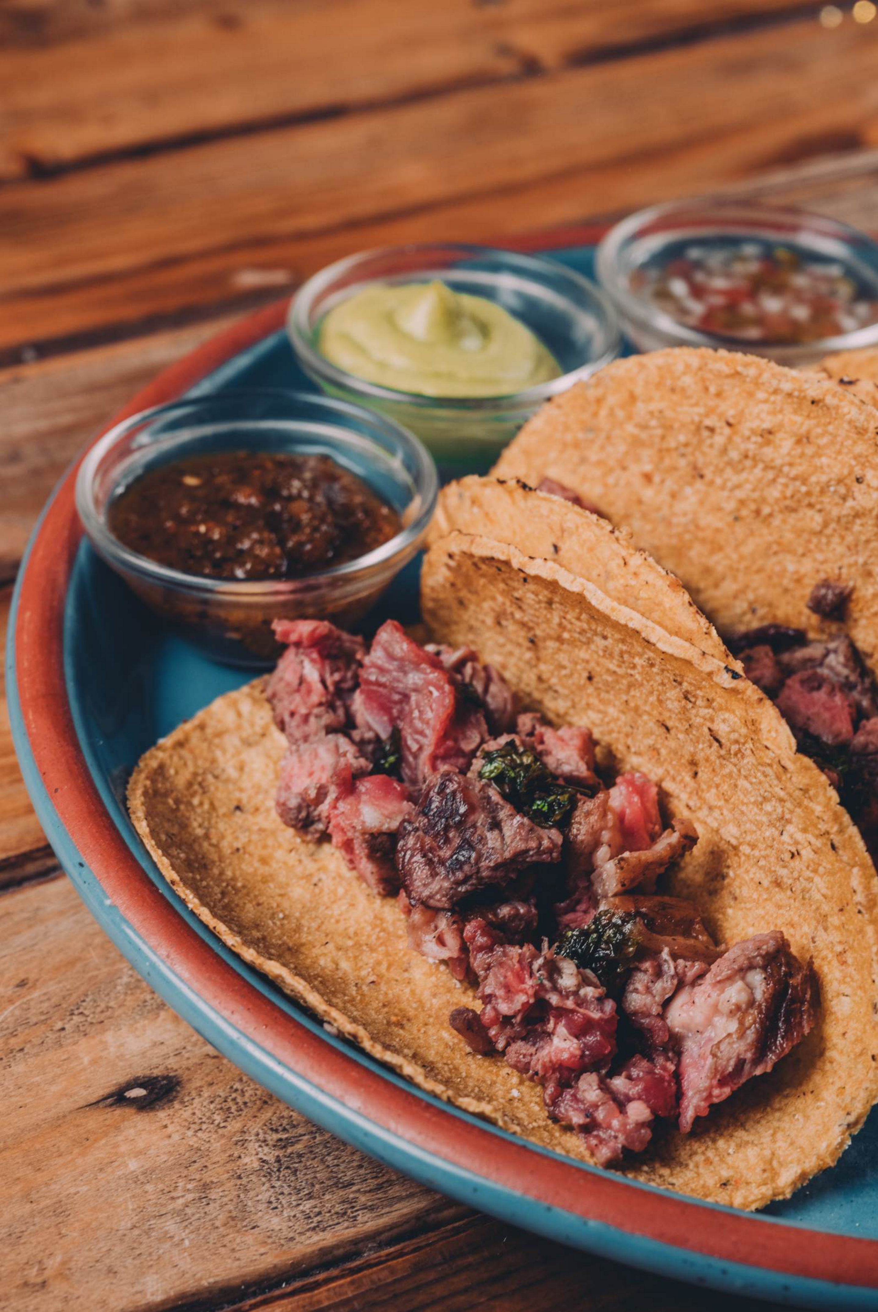
Taquitos Rib Eye