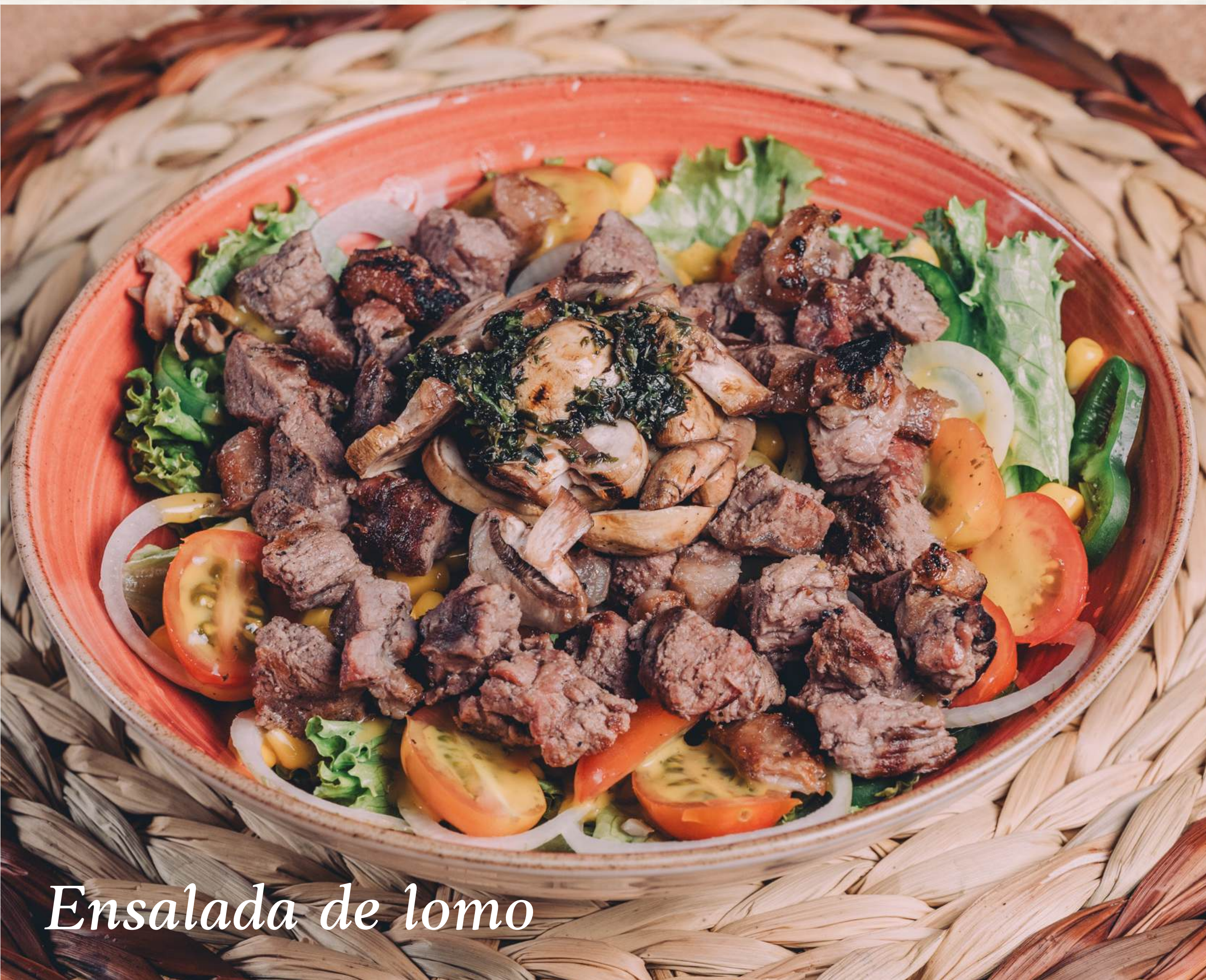
Ensalada de lomo